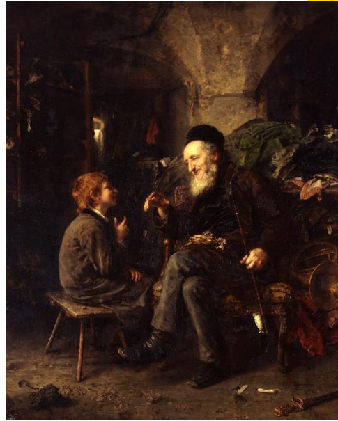
Ludwig Knaus: Salamon bölcsessége (1900 körül)

„Átala hisztek Istenben, aki feltámasztotta őt a halottak közül, és megdicsőítette, hogy higgyetek és reméljete az Istenben.”